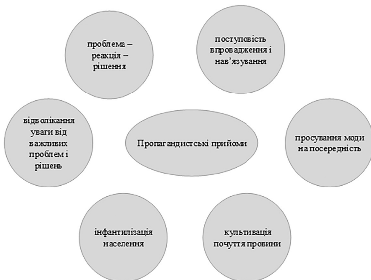
Рис. 2. Основні пропагандистські прийоми

Основні пропагандистські прийоми введення в оману, в основу яких покладено сугестивний маніпулятивний вплив, наведено на рис. 2.