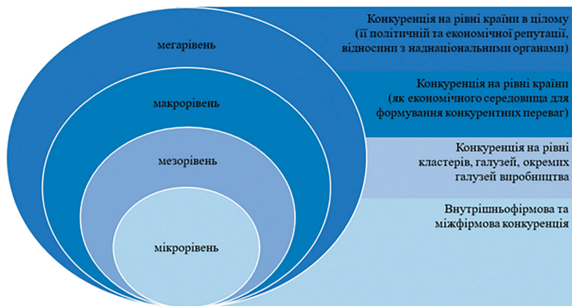
Рис. 1. Характеристика рівнів конкурентоспроможності

З іншого боку, не можна нехтувати тим фактом, що конкурентоспроможність розглядається на різних рівнях управління і вони також є визначальними під час удосконалення таксономії факторів впливу. Детальний огляд різних підходів учених-економістів свідчить, що конкурентоспроможність, як категорію, розглядають на мікро- (товарів або послуг, підприємств), мезо- (галузей, регіонів), макро- (країни, як економічного середовища для формування конкурентних переваг) та мегарівнях (країни, їх політична та економічна репутація, відносини з наднаціональними органами) (рис. 1).