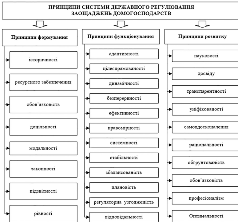
Рис. 2. Принципи системи державного регулювання заощаджень домогосподарств