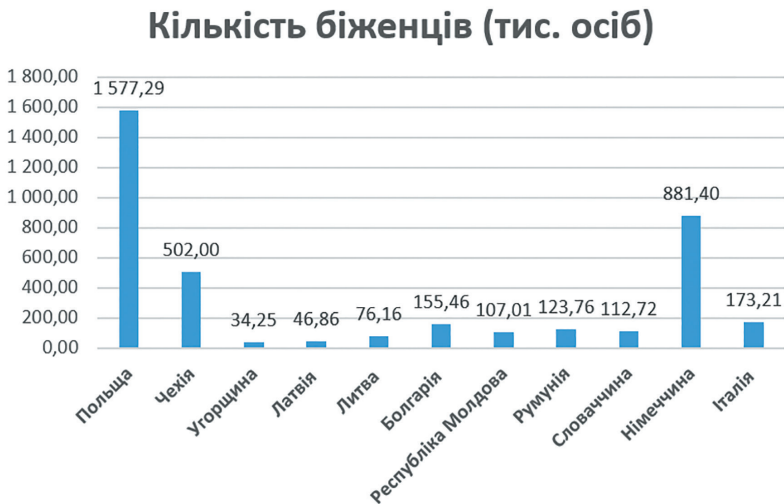
Рис. 1. Кількість зареєстрованих біженців у країнах Західної Європи

Згідно даних ООН майже 5 мільйонів українських біженців зареєструвалися для тимчасового захисту в сусідніх країнах Західної Європи (рис. 1) [8].