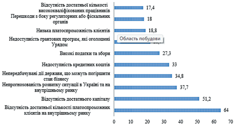
Рис. 2. Основні перешкоди розвитку підприємництва (%)

Результати дослідження UNITY «Експрес оцінка поточних шляхів молодіжного підприємництва» дозволило окреслити основні проблеми, з якими на сьогодні стикаються підприємства в своїй діяльності, та виявити основні напрями які стримують розвиток підприємств (рис. 2). До основних перешкод можна віднести зниження попиту на товар та послуги, розрив ланцюгів постачання, зростання вартості матеріалів та послуг, підвищення цін на обладнання, збільшення витрат, втрата працівників, пошук нових клієнтів та ринку збуту, недостатність оборотних коштів, втрата майна, обмежений доступ до фінансових ресурсів. Такі проблеми існують на сьогодні майже у всіх підприємствах, які здійснюють свою діяльність на території України. Ускладнює ці процеси низький рівень прогнозованості розвитку подій, через високу мінливість та непередбачуваність зовнішнього середовища. Згідно з опитуваннями Європейської Бізнес Асоціації, власна оцінка підприємств своєї фінансової та виробничої спроможності погіршується, у більшості підприємств фінансової спроможності залишається на кілька місяців. Більш стабільні фінансові активи є лише в 5% всіх опитуваних підприємств [6–7, 10].