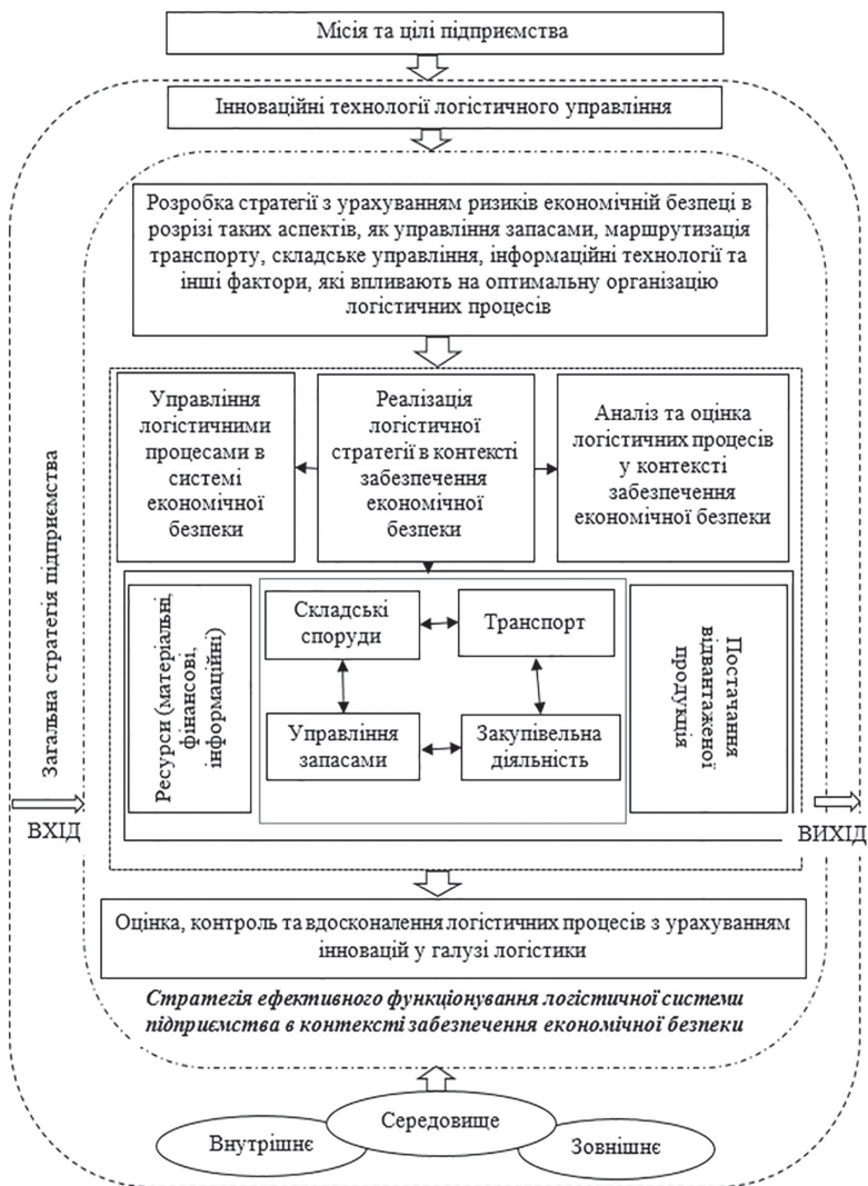
Рис. 2. Схема формування стратегії ефективного функціонування логістичної системи підприємства в контексті забезпечення економічної безпеки